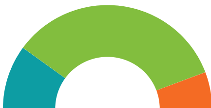
Activities at Multiple Schools vs Single School